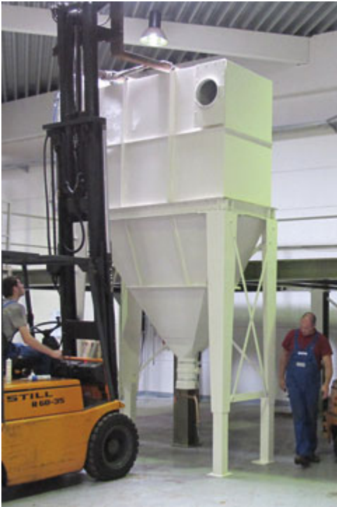
1 Big-Bag Entleerstation